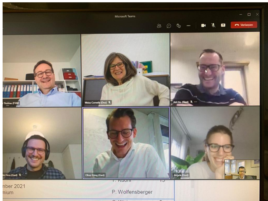
Videokonferenz Vorstandssitzung 9. Dezember 2021